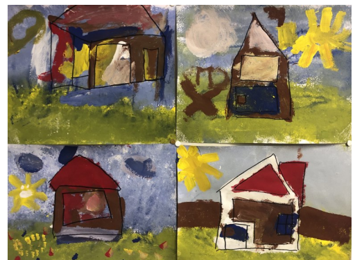
Een huis schilderen.