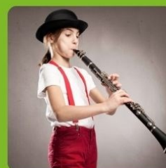
Klarinetles - Muziek- vereniging UNI