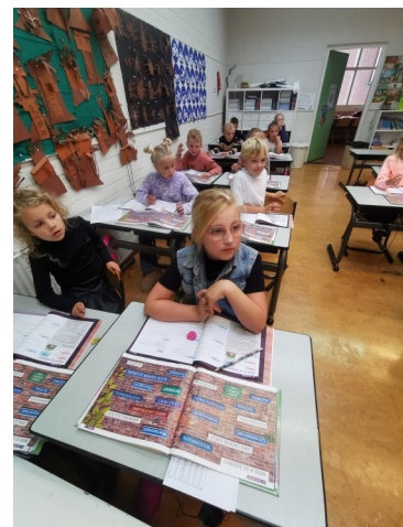
Groetjes van groep 4A