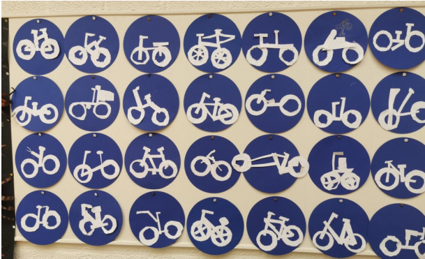
Knutselen en tekenen over het thema "onderweg".