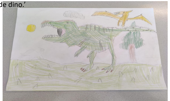
Tekening gemaakt door: Fièn

Mats: 'Het leukste vond ik de dinosaurussen en dieren. De dino's maakten zelfs geluid! En ik heb veel vragen beantwoord over de dino.'