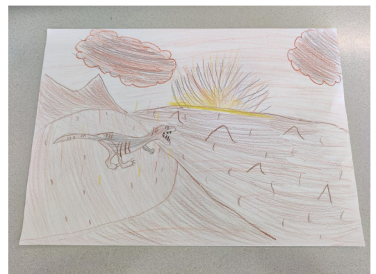
Tekening gemaakt door: Julie

Liam: 'Ik vond het leuk dat we in een kamer extra opdrachten konden doen en daar was een hele realistische stad, waar je met een verrekijker kon kijken.'