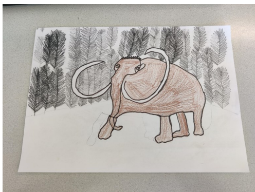
Tekening gemaakt door: Naut

Lizzy: 'Ik vond het leuk dat je spellen kon spelen en kon tekenen. Ik vond het superleuk en weet nu ook meer over hyena's.'